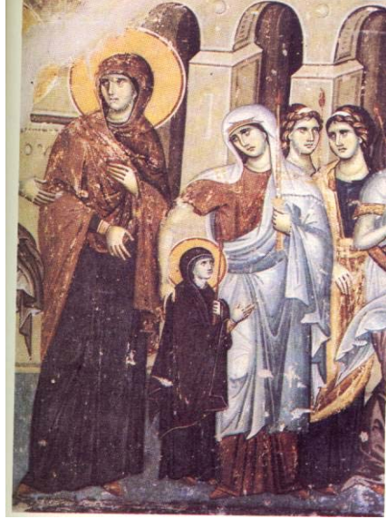
Τά Εἰσόδια τῆς Θεοτόκου

Το «πρωτοευαγγέλιο» λέγει ὅτι ἡ Μαρία μέσα στό ναό τρε-φόταν ἀπό ἄγγελο Κυρίου: « Ἡ δέ Μα-ρία ζοῦσε μέσα στό Ναό τοῦ Κυρίου τρεφόμενη σάν περι-στέρι καί ἔπαιρνε τήν τροφή της ἀπό τό χέρι ἄγγελου».