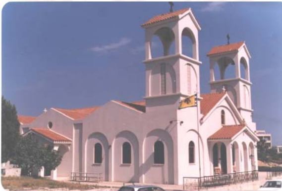
21.Η ΑΠΟΧΩΡΗΣΗ ΑΠΟ ΤΟ ΝΑΟ.

Θά πρέπει νά ποῦμε ὅτι ἐξαιροῦνται ὅσοι γιά διάφορους σοβαροὺς λόγους δέ μποροῦν νά σταθοῦν τόση ὥρα, ἄς σταθοῦν ὅσο μποροῦν αὐτοί.