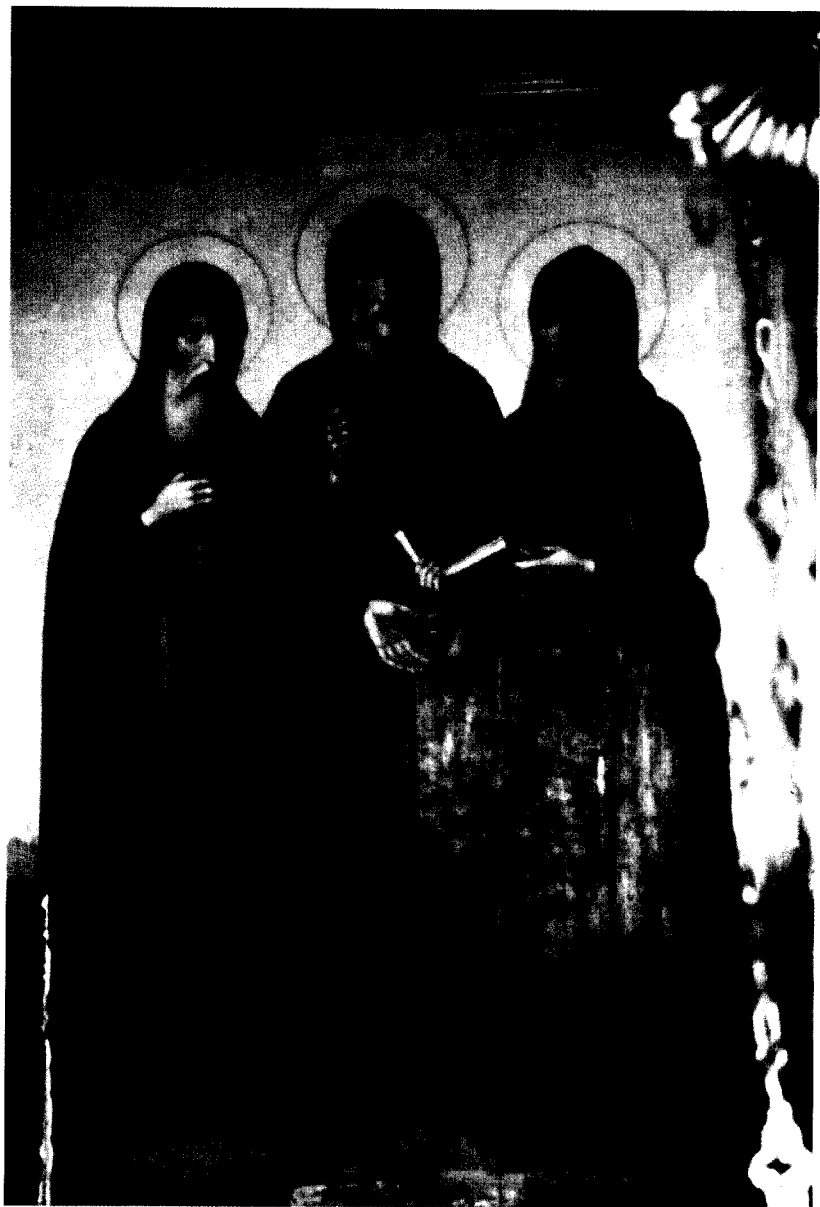
Sfinții Protectori ai Bătrânului Porfirie: Nifon Atonitul, Acachie și Maxim Kafsokalivitul